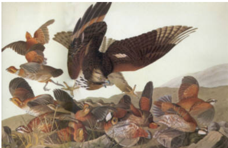
Bobwhiite (Colinus virginianus) angribes af Red-shouldered Hawk (Buteo lineatus) . Vel det af alle Audubons illustrationer med mest action og liv.

Audubon rejste nu fra sted til sted og tilbød sig som portrætmaler. Engang blev han hentet ud i skoven til et nyligt dødt og begravet barn, der igen blev opgravet. Audubon skrev herom i sin journal: "Jeg gav forældrene et portræt, som var barnet stadig i live til deres fulde tilfredshed" .