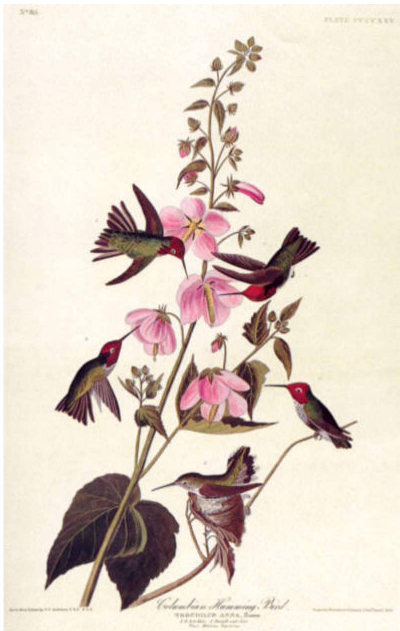
Annas Kolibri. Prøv at sammenligne dette billede med kolibri illustrationer af John Gould.

Audubon fik malet 23 billeder på turen og skrev i sin dagbog: " Sjældent i mit liv har jeg forladt et land med så lidt vemod som denne gang ".