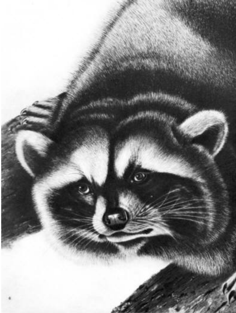
Vaskebjørn ( Procyon lotor ). Fra Audubon and Backman's Viviparous Qadrupeds of North America .