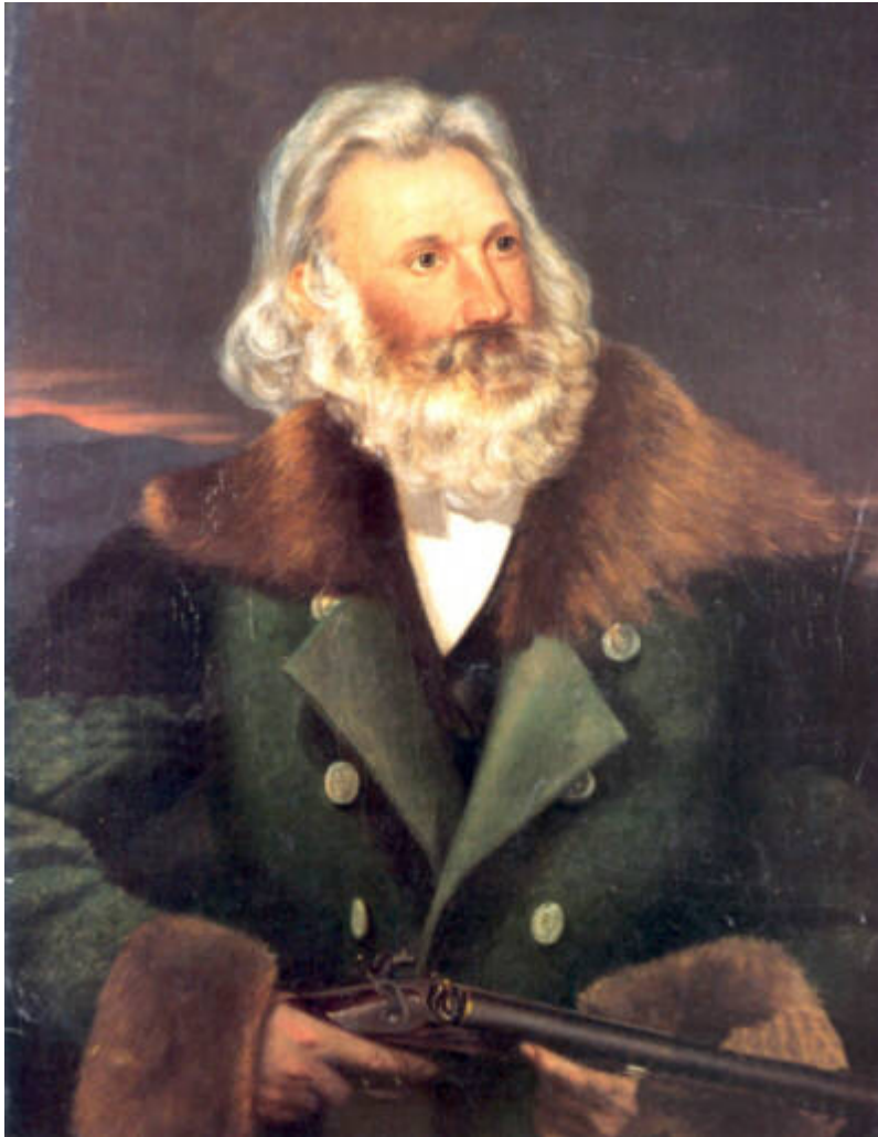
Dette billede af Audubon er malet af hans søn John Woodhouse Audubon.