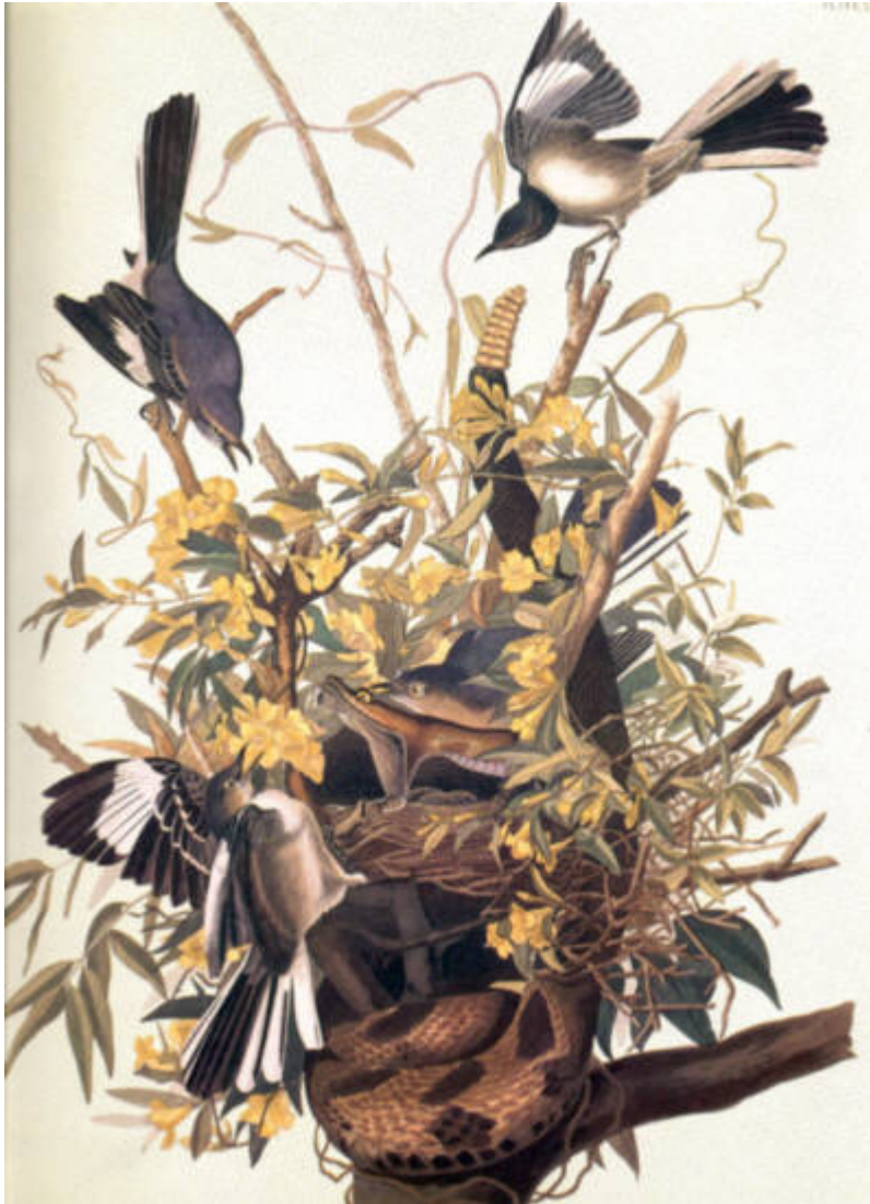
Mockingbird ( Mimus polyglottos ) og klapperslangen, billedet, der gav Audubon så mange ærgrelser.